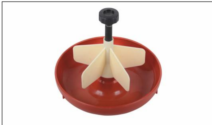
прикормочная кормушка для поросят

Автокормушка для поросят 1-литровая выполнена из высококачественного пластика. Используется с целью расширения рациона подсосных поросят и подготовки их к приёму сыпучих кормов. Предназначена для молока, воды и сыпучего корма.