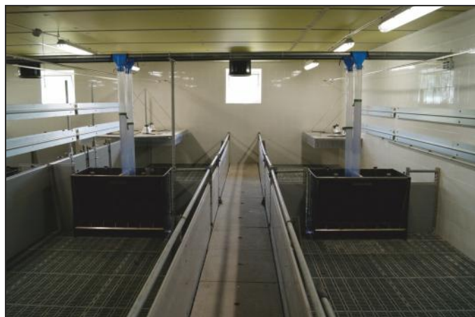
загон для подсвинков – манеж, оборудованный двойной бункерной автокормушкой для поросят на 7 мест с каждой стороны