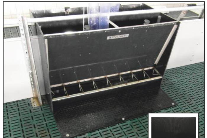
резиновый мат, установленный под бункерной кормушкой