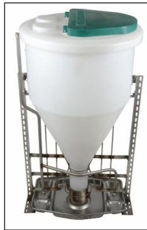
MULTIMAT W одинарный, рама отделана уголками