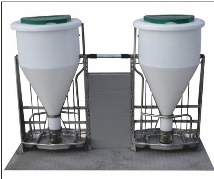
MULTIMAT двойной, установлен на основание из рифлёной жести