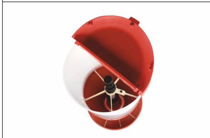
прикормочная кормушка для подсвинков