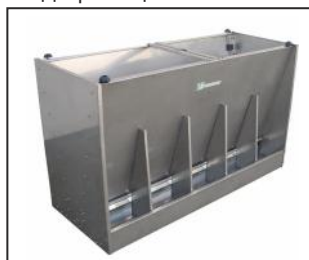
автокормушка бункерная, двойная, из нержавеющей стали

Размер автокормушки также должен быть правильно подобран к количеству животных в загоне. Мы предлагаем автокормушки, у которых число секций в корыте составляет от 2 до 12, в одно- и двухсторонней модификации.