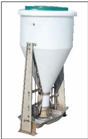
MULTIMAT T одинарный, свободностоящий