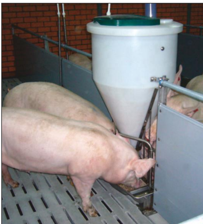
откормочный цех - загон оборудован одинарной автокормушкой MULTIMAT T