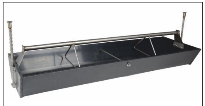
прикормочная кормушка для поросят - корыто вставляется в решётку