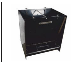
автокормушка бункерная, двойная, из полипропилена