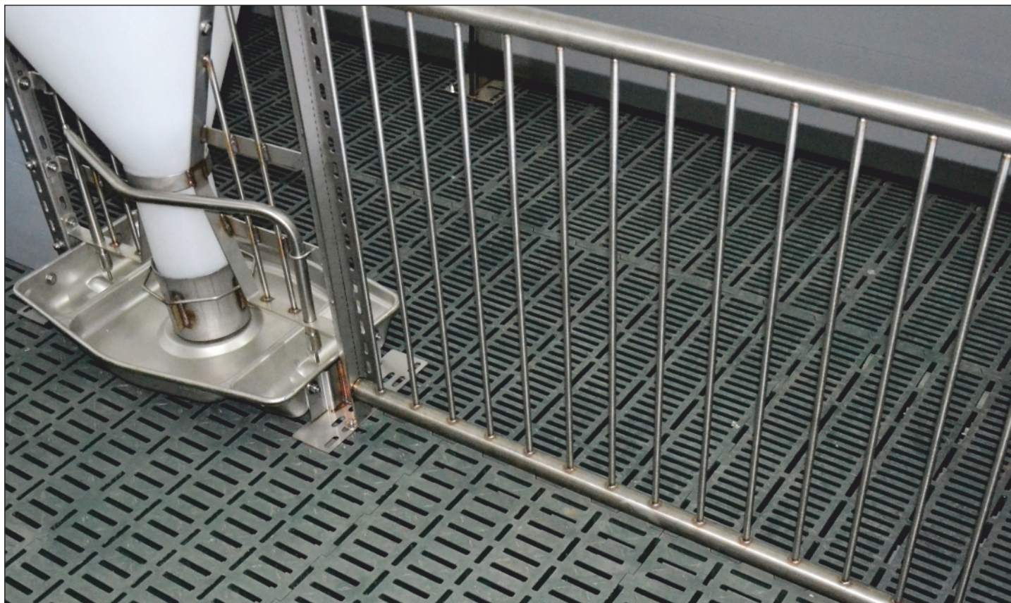
загон для подсвинков с решётчатым ограждением