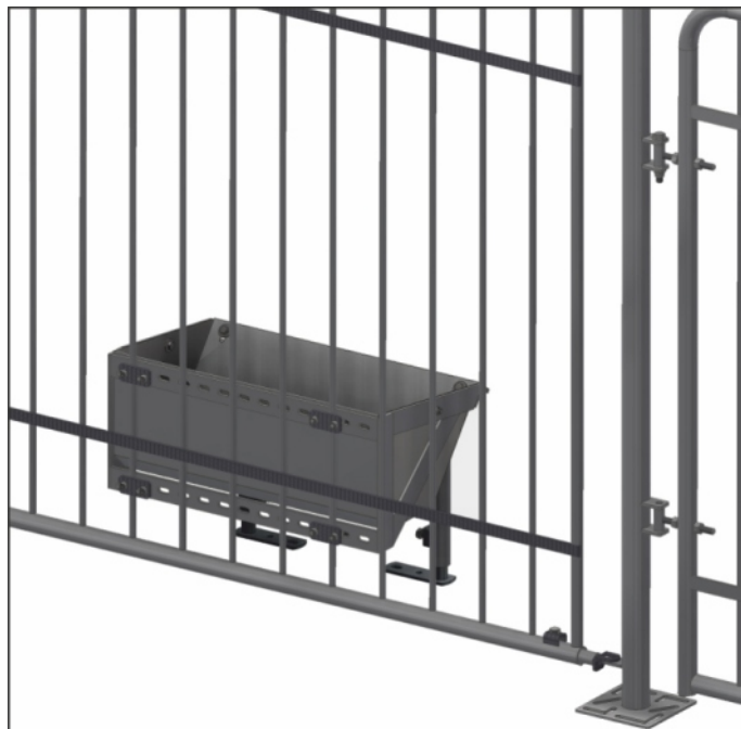
решётчатое ограждение в стойке для хряка, с нержавеющей корытом