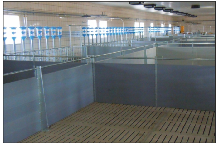
секция из досок ПВХ в отделении для супоросных свиноматок