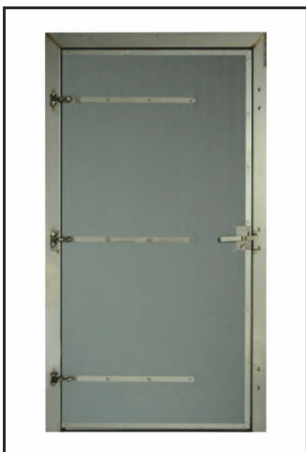
двери для хозблоков цельные