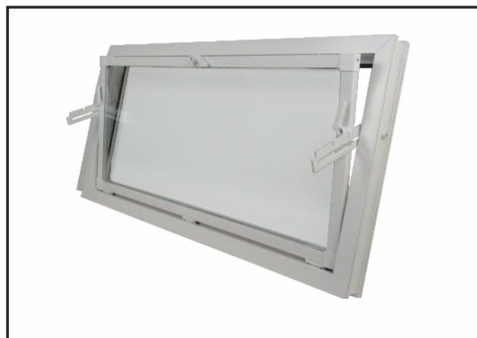
окна для хозблоков размером 120 x 90 см