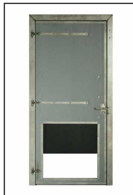
двери для хозблоков с отверстием и задвижкой