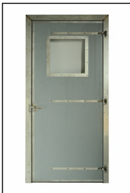
двери для хозблоков с окном