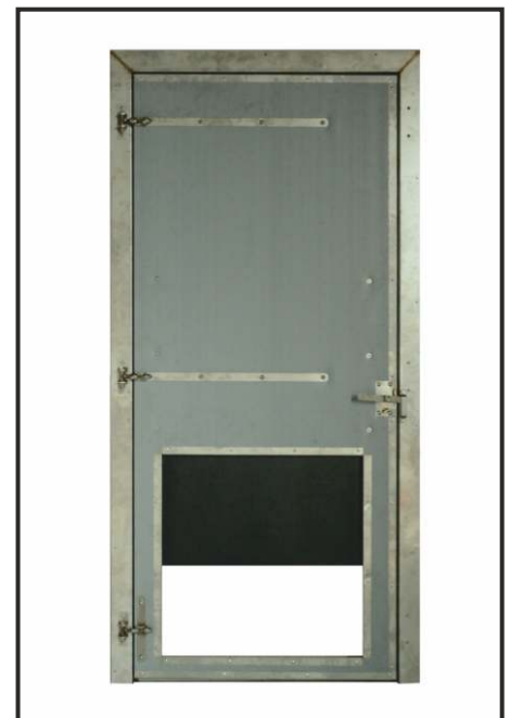
drzwi inwentarskie z otworem i zasuwą