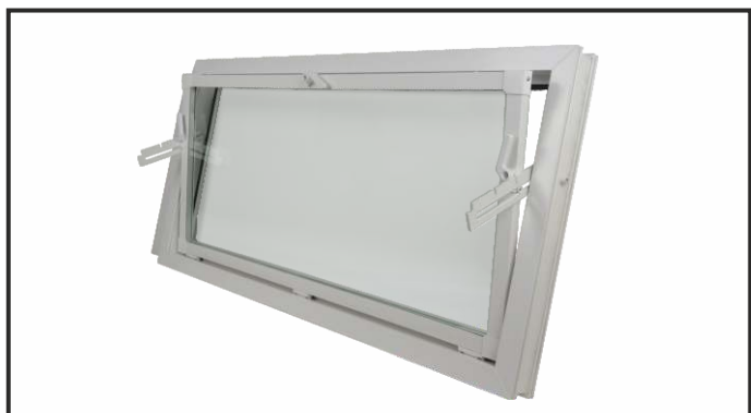
okno inwentarskie o wymiarach 120 x 90 cm