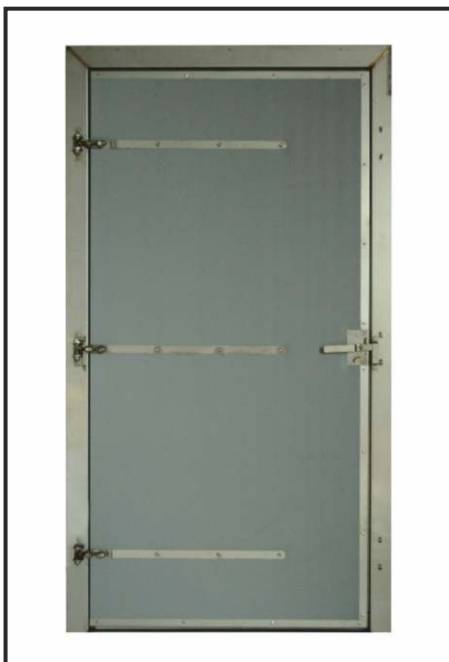
drzwi inwentarskie pełne