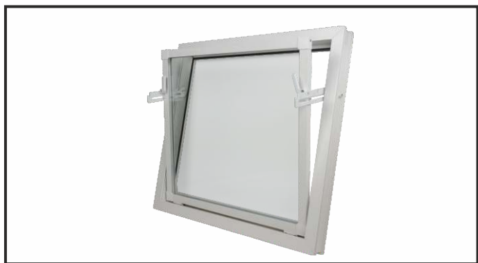
okno inwentarskie o wymiarach 86,5 x 83,5 cm

Wykonane są z profilu PVC oraz podwójnej szyby. Idealnie nadają się do pomieszczeń budynków, w których panują trudne warunki atmosferyczne. Są odporne na zmiany wilgotności powietrza, promieniowanie słoneczne (odporność na przebarwienia) oraz na kwaśne środowisko biochemiczne panujące w budynkach inwentarskich. Nasze okna posiadają pięciokomorowe profile, co gwarantuje ich większą stabilność. Niewielkie wymiary ościeżnic oraz listew przyszybowych pozwalają na uzyskanie maksymalnie dużej powierzchni szkła, dzięki czemu transmisja światła do wnętrza budynku może być zwiększona do 50%.