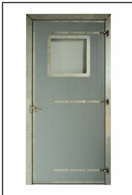
drzwi inwentarskie z oknem